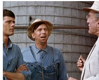
1966 UNE SACRÉE FRIPOUILLE (The Flim-Flam Man) d'I. Kershner avec M. Sarrazin, S. Pickens