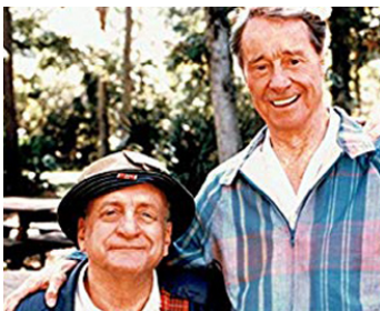
1986 PALS (Pals) de Lou Antonio avec Don Ameche