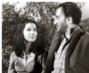
1969 THIS SAVAGE LAND de Vincent McEveety avec Brenda Scott