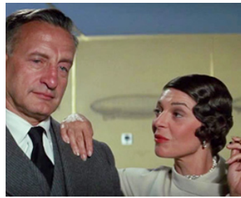
1975 L'ODYSSÉE DU HINDENBURG (The Hindenburg) de R. Wise avec Anne Bancroft