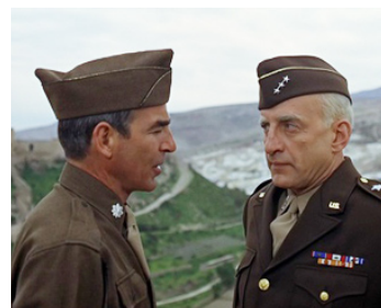
1969 PATTON (Patton) de Franklin J. Schaffner avec Paul Stevens