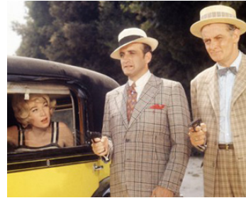
1964 LA ROLLS-ROYCE JAUNE (The yellow Rolls-Royce) d'A. Asquith avec S. MacLaine, A. Cartney