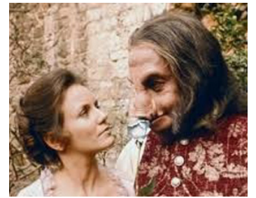
1976 LA BELLE ET LA BÊTE (Beauty and the Beast) de Fielder Cook avec Trish Van Devere