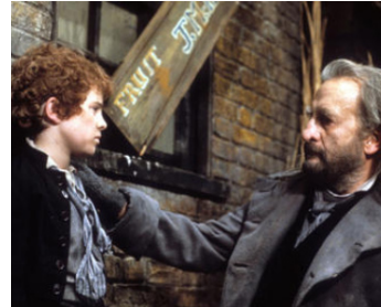
1982 OLIVER TWIST (Oliver Twist) de Clive Donner avec Richard Charles