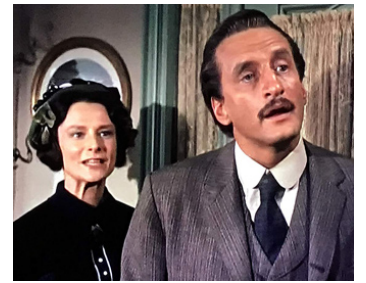
1962 PANIQUE À L'OUEST (The brazen Bell) de James Sheldon avec Anne Meacham