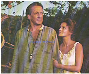
1974 THE SAVAGE IS LOOSE de George C. Scott avec Trish Van Devere