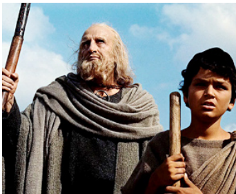
1965 LA BIBLE (The Bible) de John Huston avec Alberto Lucantoni