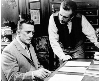
1963 LE DERNIER DE LA LISTE (The List of Adrian Messenger) de John Huston avec Kirk Douglas