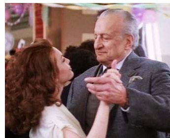
1990 L'ANGE DÉCHU (Descending Angel) de Jeremy Paul Kagan avec Diane Lane