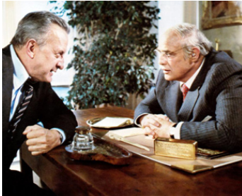
1980 LA FORMULE (The Formula) de John G. Avildsen avec Marlon Brando