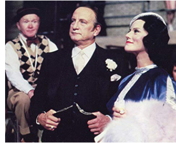
1978 FOLIE, FOLIE (Movie, Movie) de Stanley Donen avec Trish Van Devere