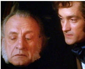
1984 A CHRISTMAS CAROL de Clive Donner avec Robert Rees