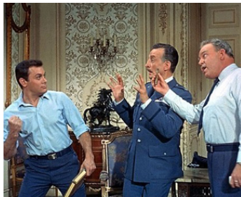
1966 DEUX MINETS POUR JULIETTE (No with my wife, don't you) de N. Panama avec Tony Curtis