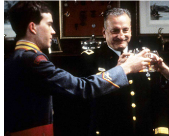
1981 TAPS (Taps) d'Harold Becker avec Timothy Hutton