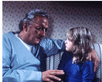
1984 CHARLIE (Firestarter) de Mark L. Lester avec Drew Barrymore