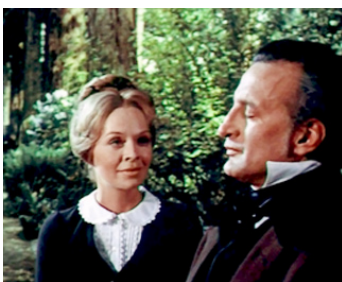
1970 JANE EYRE (Jane Eyre) de Delbert Mann avec Susannah York