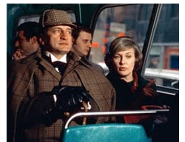
1970 LE RIVAGE OUBLIÉ (They might be giants) d'Anthony Harvey avec Joanne Woodward