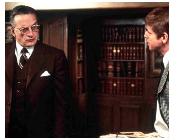
1975 PROCÈS SOUS TENSION (The Fear Trial) de Lamont Johnson avec William Devane