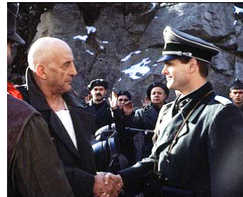
1985 MUSSOLINI (Mussolini, the untold Story) de William A. Graham avec David Suchet