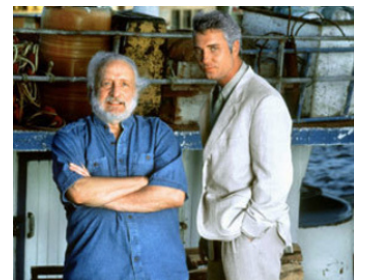
1993 CURAÇAO (Deadly Currents) de Carl Schultz avec William Petersen