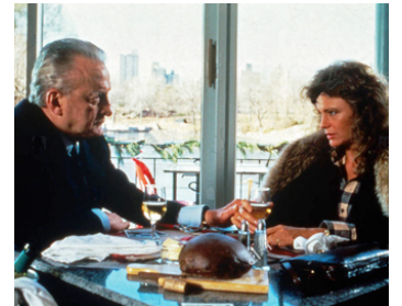
1986 LES CHOIX DE VIE (Choices) de David Lowell Rich avec Jacqueline Bisset