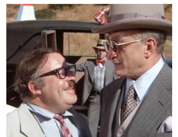
1974 BANK SHOT (Bank Shot) de Gower Champion avec Sorrell Brooke