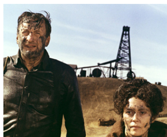
1973 L'OR NOIR DE L'OKLAHOMA (Oklahoma Crude) de Stanley Kramer avec Faye Dunaway