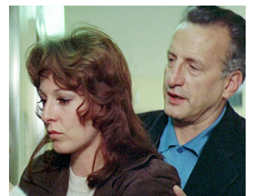
1972 LES FLICS NE DORMENT PAS LA NUIT (The New Centurions) de R. Fleischer avec Jane Alexander