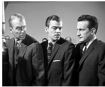
1959 AUTOPSIE D'UN MEURTRE (Anatomy of a murder) d'O. Preminger avec J. Stewart, B. West