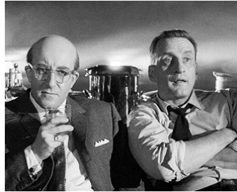
1963 DOCTEUR FOLAMOUR (Dr Strangelove) de Stanley Kubrick avec Peter Sellers