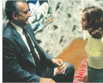
1977 HARDCORE (The Hardcore Life) de Paul Schrader avec Leslie Ackerman