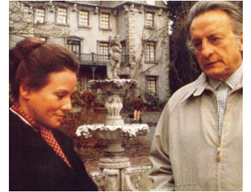
1979 L'ENFANT DU DIABLE (The Changeling) de Peter Medak avec Trish Van Devere