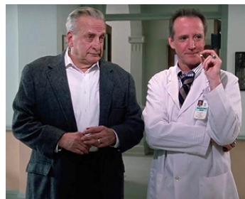
1989 L'EXORCISTE, LA SUITE (The Exorcist III) de William Peter Blatty avec Scott Wilson