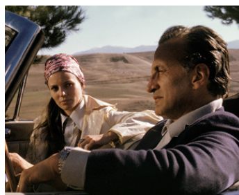
1971 LES COMPLICES DE LA DERNIÈRE CHANCE (The last run) de R. Fleischer avec Trish Van Devere