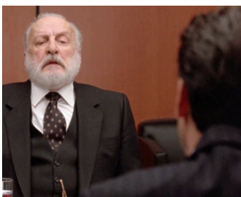
1993 MALICE (Malice) d'Harold Becker avec Alec Baldwin