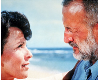
1976 L'ÎLE DES ADIEUX (Islands in the Stream) de Franklin J. Schaffner avec Claire Bloom