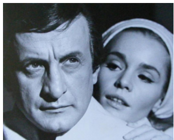
1967 THE CRUCIBLE (The Crucible) d'Alex Segal avec Tuesday Weld