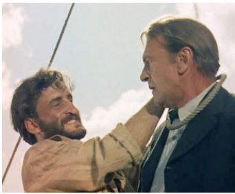
1958 LA COLLINE DES POTENCES (The hanging Tree) de Delmer Daves avec Gary Cooper