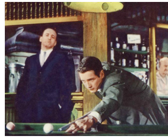
1961 L'ARNAQUEUR (The Hustler) de Robert Rossen avec Paul Newman