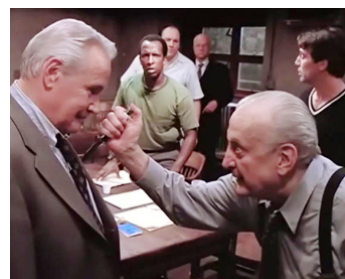
1997 DOUZE HOMMES EN COLÈRE (12 angry Men) de William Friedkin avec Jack Lemmon